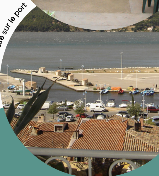
vue de la terrasse sur le port